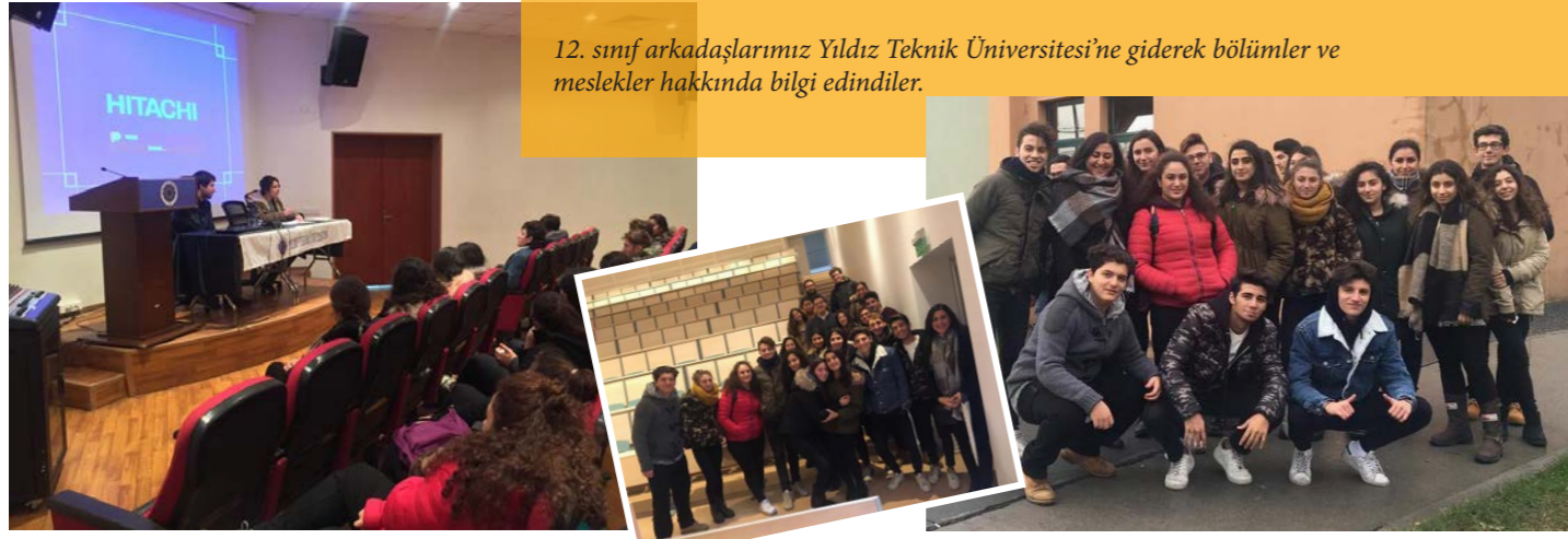
12. sınıf arkadaşlarımız Yıldız Teknik Üniversitesi'ne giderek bölümler ve meslekler hakkında bilgi edindiler.