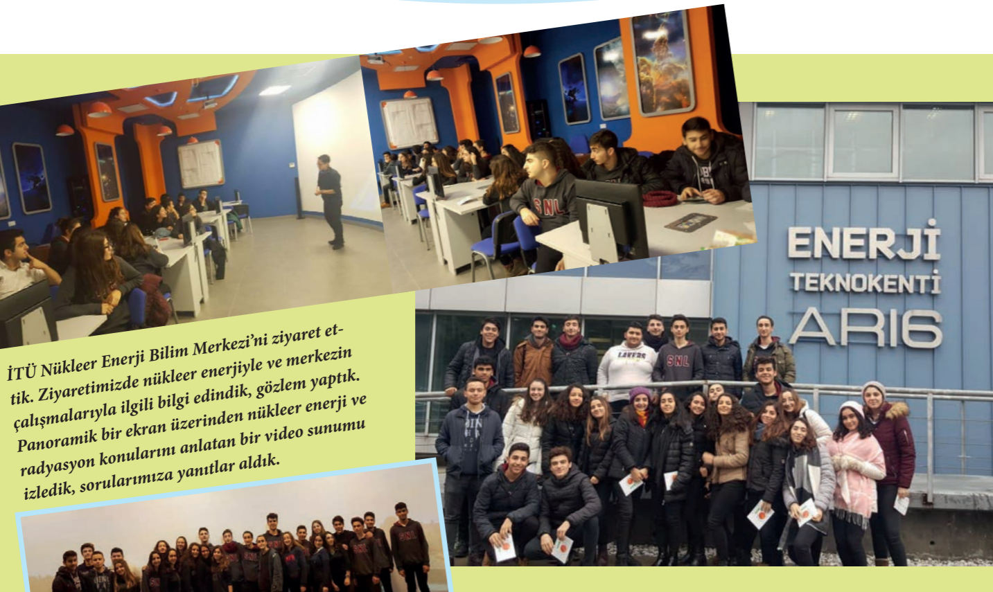
İTÜ Nükleer Enerji Bilim Merkezi'ni ziyaret ettik. Ziyaretimizde nükleer enerjiyle ve merkezin çalışmalarıyla ilgili bilgi edindik, gözlem yaptık. Panoramik bir ekran üzerinden nükleer enerji ve radyasyon konularını anlatan bir video sunumu izledik, sorularımıza yanıtlar aldık.