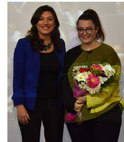
larım, öğretmenlerim bana lütfen kızmayın, ben içimdeki müzik aşkını az da olsa

sonra içimde biriken duyguları kağıda aktarmamın benim için etkili bir yöntem olduğunu keşfettim. Şuan ise beni büyüten ve besleyen gıdanın müzik olduğu. Müzisyen oldum diyemiyorum, her gün daha çok geliştiriyorum kendimi, elbette yoruluyorum ve bazen pes edecek duruma geliyorum ama anahtar kelime "yılmamak". Şimdi 16 yaşımaya dönsem, ne derdim kendime bilmiyorum. Çok küçük yaşlarda bazı seçimler yapmaya maruz bırakılıyor. Üniversite sınavına giriyoruz, yazdığımız bölümü okuduktan belki de 2 yıl sonra aslında oraya ait olmadığımızı hissediyoruz. Kimileri için geç sayılsa da bence değil, her zaman önemli olan sizsiniz.. Oryant-